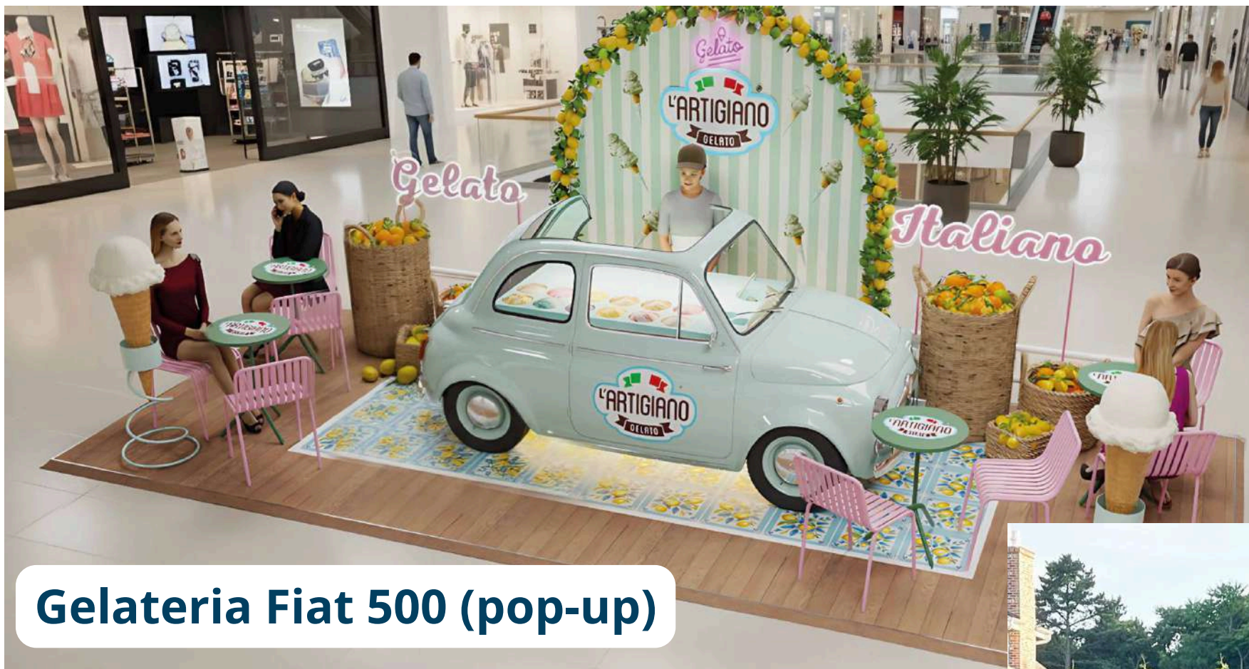
Gelateria Fiat 500 (pop-up)

El concepto puede operar en diferentes formatos: