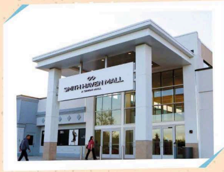
SMITH HAVEN MALL

313 Smith Haven Mall, Lake Grove, NY 11755